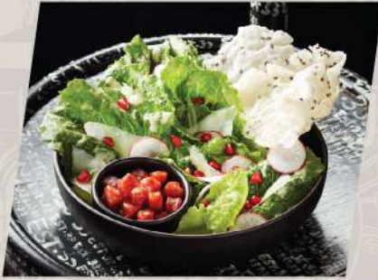
Caesar Crispy Salad ซีซาร์สลัด