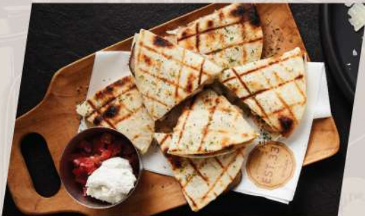
DE-YA เคสชาติย่างไก่หมักเบียร์