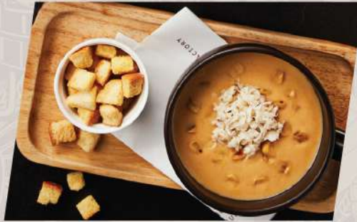
Crab and Corn ซูปครีมปูข้าวโพดย่าง

*ราคา set ข้างต้นไม่รวมเครื่องดื่ม **ราคาไม่รวม vat และ service charge