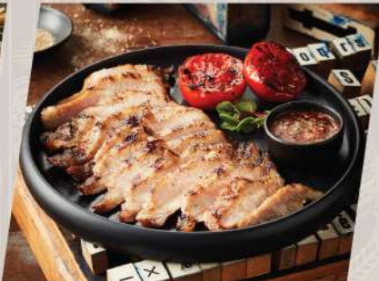
Kurobuta Pork Neck คอหมูย่างถ่านหินภูเขาไฟ