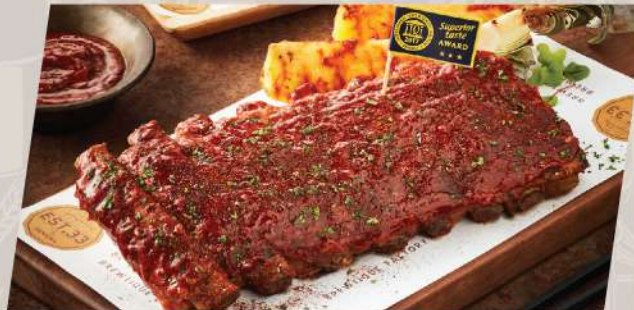
ESTer Ribs Classic / Spicy ซี่โครงหมอบซอสบาร์บีคิวรสคลาสสิก / รสเผ็ด สูตร EST.33