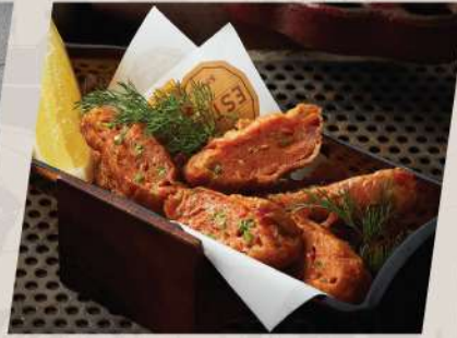
Fish in the bottle ทอดมันกุ้งและปลา