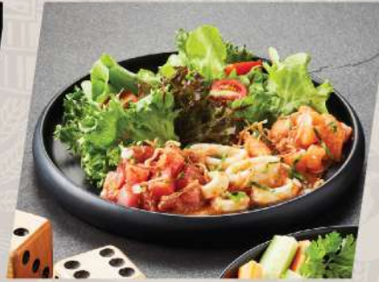
Trio Seafood Wazabi ยำซีฟู้ดกับซอสวาซาบิ