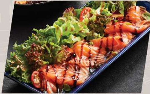
Salmon Gravlax Salad สลัดแซลมอนสโตลส์แกนดิเนเวีย