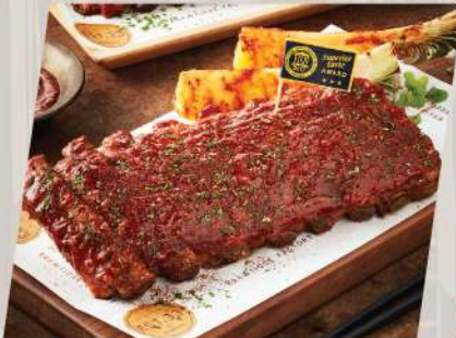
ESTer Ribs Classic / Spicy ซี่โครงหมอบซอสบาร์บีคิวรสคลาสสิก / รสเผ็ด สูตร EST.33