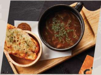
Onion Soup ซุปหัวหอมน้ำใส

*ราคา set ข้างต้นไม่รวมเครื่องดื่ม **ราคาไม่รวม vat และ service charge