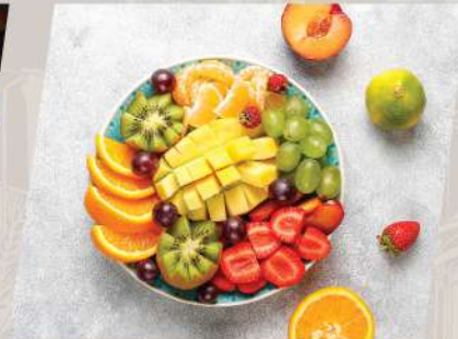
Seasonal Fruit ผลไม้ตามฤดูกาล