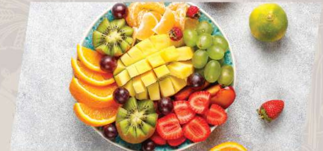
Seasonal Fruit ผลไม้ตามฤดูกาล