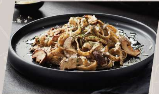
Truffle Alfredo พาสต้าอัลเฟรโดครีมทรัฟเฟิล