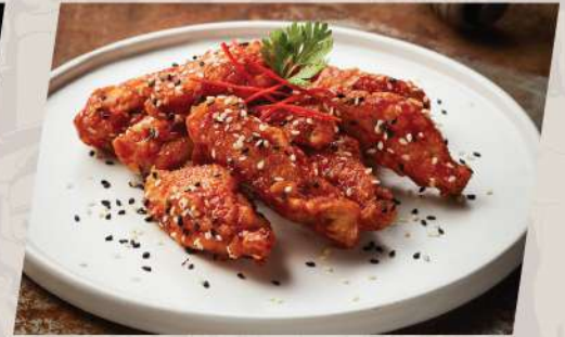
Sesame Wings ปีกไก่ทอดซอสวา