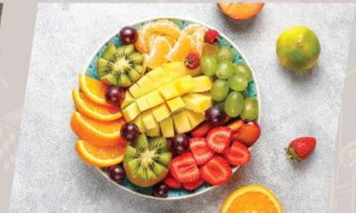
Seasonal Fruit ผลไม้ตามฤดูกาล