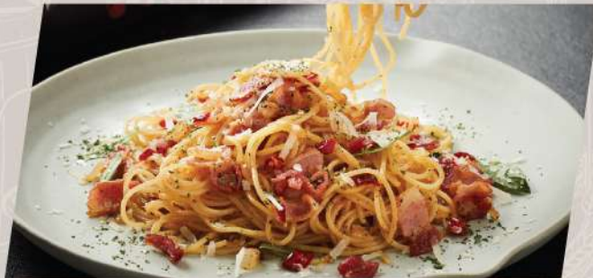
Oh !!! Bacon พาสต้าผัดพริกแห้งกระเทียมเบคอน