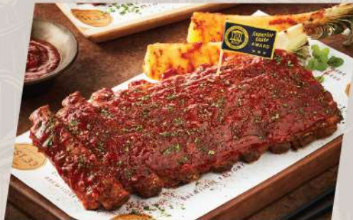
ESTer Ribs Classic / Spicy ซี่โครงหมูอบซอสบาร์บีคิวรสคลาสสิก / รสเผ็ด สูตร EST.33