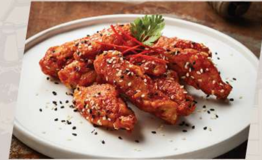
Sesame Wings ปีกไก่ทอดซอสวา