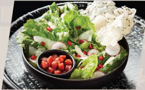
Caesar Crispy Salad ซีซาร์สลัด