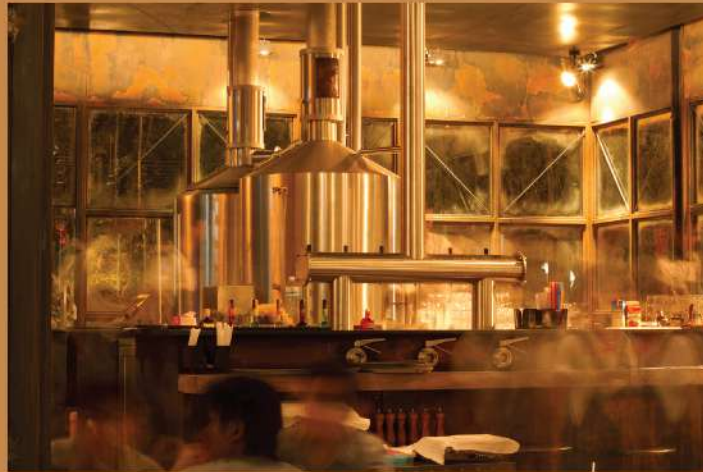
EST.33 The Nine Center Rama 9