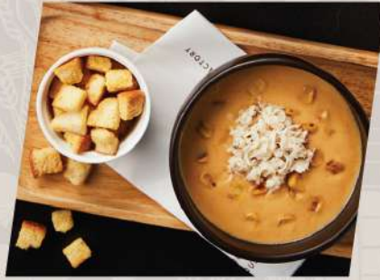
Crab and Corn ซูปครีมปูข้าวโพดย่าง