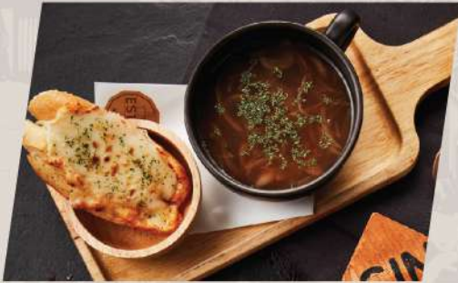
Onion Soup ซูปหัวหอมน้ำใส

*ราคา set ข้างต้นไม่รวมเครื่องดื่ม **ราคาไม่รวม vat และ service charge