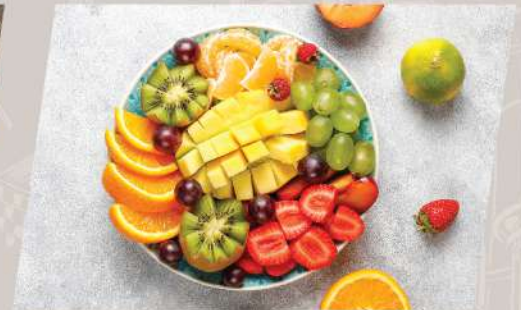
Seasonal Fruit ผลไม้ตามฤดูกาล