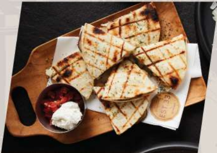
DE-YA เคสชาติย่างไก่หมักเบียร์