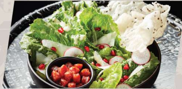
Caesar Crispy Salad ซีซาร์สลัด