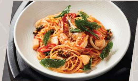
Kee Mao Seafood พาสต้าผัดซีเมาทะเลสดเผ็ด