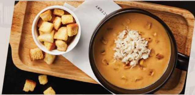
Crab and Corn ซูปครีมปูข้าวโพดย่าง

*ราคา set ข้างต้นไม่รวมเครื่องดื่ม **ราคาไม่รวม vat และ service charge