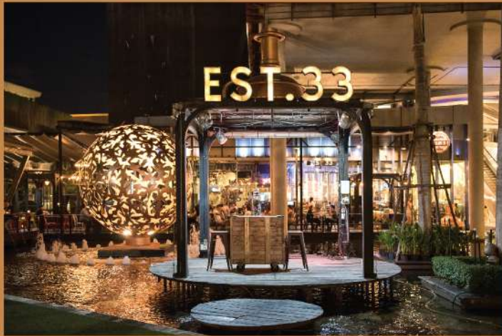
EST.33 Crystal Design Center