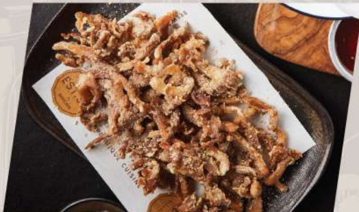
Heavenly Mushroom เห็ดสวรรค์โรยข้าวมอลต์คั่ว