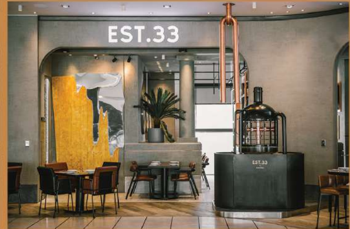
EST.33 Singha Complex