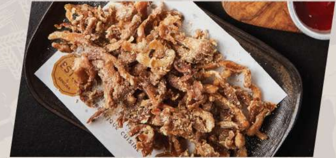
Heavenly Mushroom เห็ดสวรรค์โรยข้าวมอลต์คั่ว