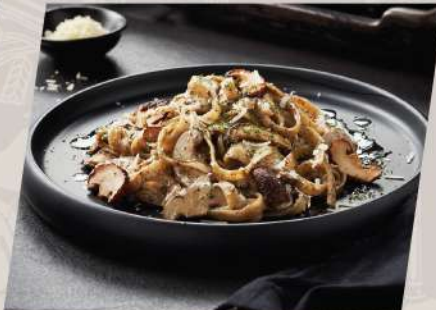
Truffle Alfredo พาสต้าอัลเฟรโดครีมทรัฟเฟิล