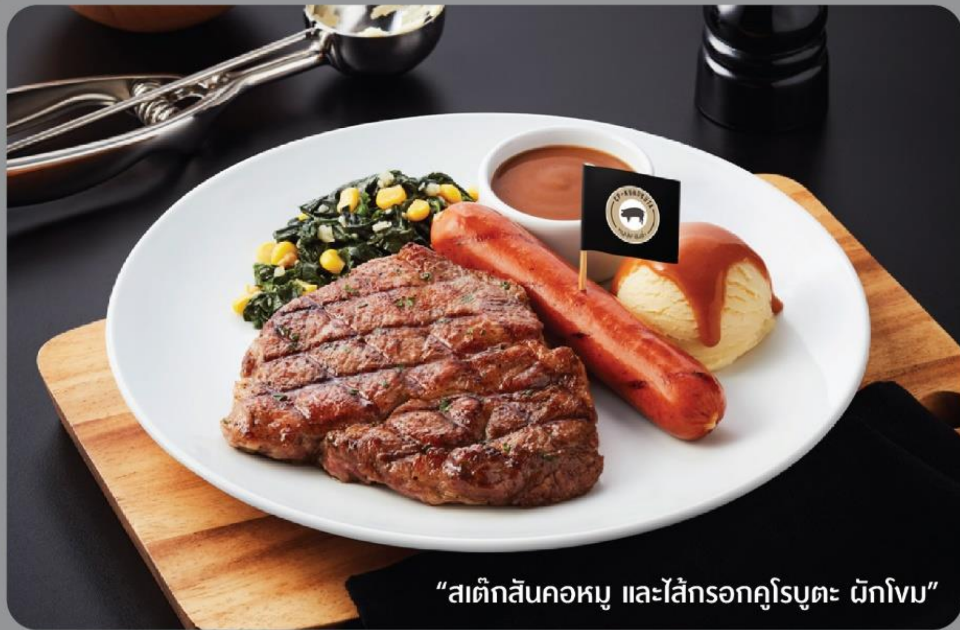
“สเต็กสันคอหมู และไส้กรอกคูโรบูตะ ด้กโงม”