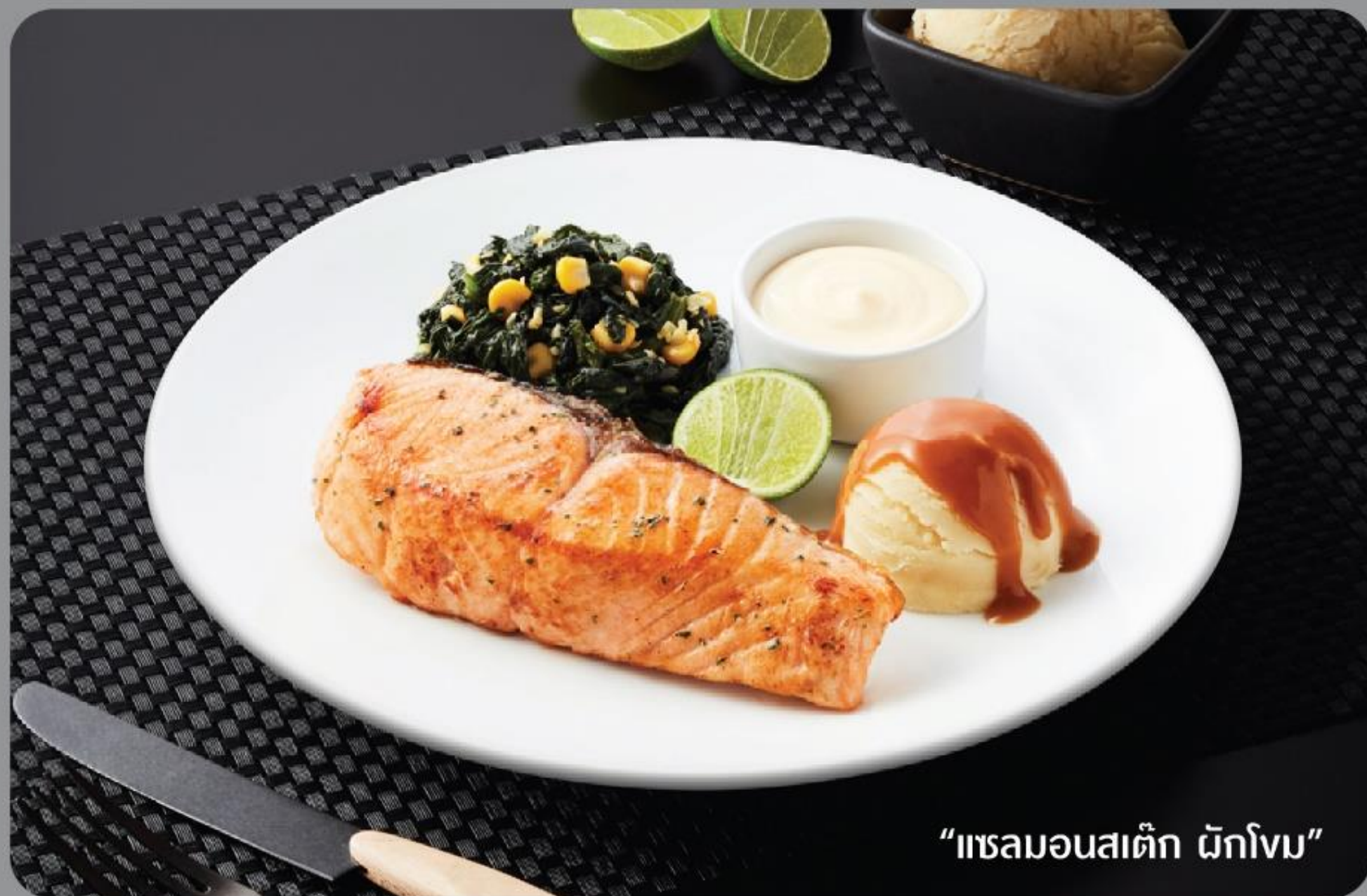
“แซลมอนสตั๊ก ด้กโงม”

สตั๊กไก่ ส่วนที่อร่อยของไก่ คือส่วนสะโพกเรานำมาหมักสดที่ร้านปรุงจนสุกหอมกรุ่น เมนูแบบกินง่ายสบายใจไม่ต้องคิดมาก เสิร์ฟคู่กับไส้กรอกคุโรบูตะ อร่อยจนต้องบอกต่อเลยทีเดียวน