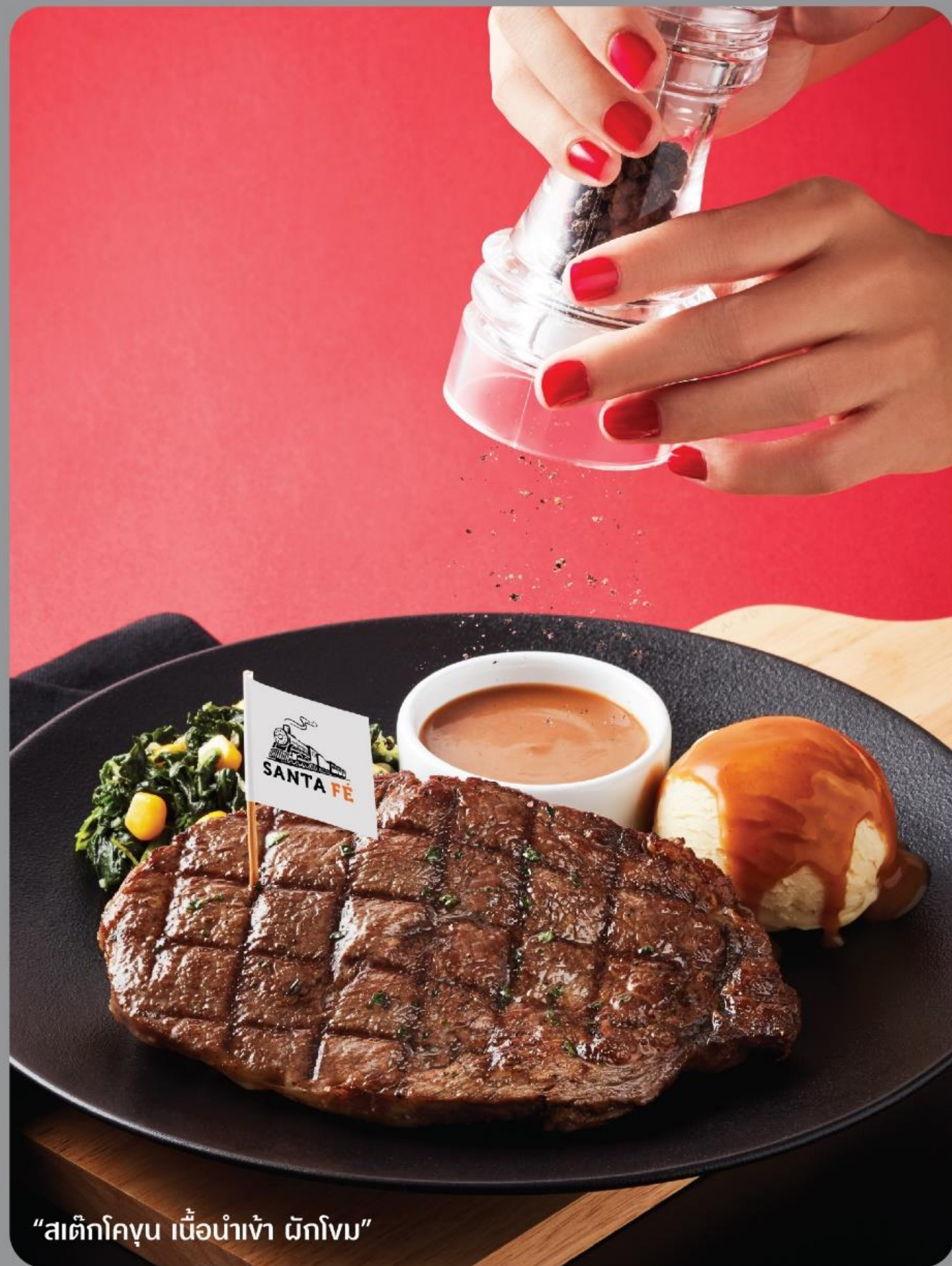
“สติกโกขุน เนื้อนำเข้า ผักโขม”

สติกเนื้อวัวสายพันธุ์เยี่ยม คัดสรรจากแหล่งต้นกำเนิดชั้นดี เลื่องชื่อในเรื่องรสชาติ เกรดพรีเมียม นำมาคลุกเคล้า ด้วยเครื่องเทศสูตรเฉพาะของซานตาเฟ อย่างพิถีพิถันจนหอมกรุ่น เพื่อเป็นสติกเนื้อจานอร่อย เสิร์ฟเคียงผักโขมและมันบด พร้อมกับบราวน์ซอส หรือ ใครที่ชื่นชอบเฟรนช์ฟราย ก็สามารถสั่งเป็นเมนู “สติกโกขุน เนื้อนำเข้า” สติกเนื้อวัว จะเสิร์ฟคู่กับเฟรนช์ฟราย สับปะรด และโคลสลอว์ ก็อร่อยที่ได้ตัวอย่างลงตัว