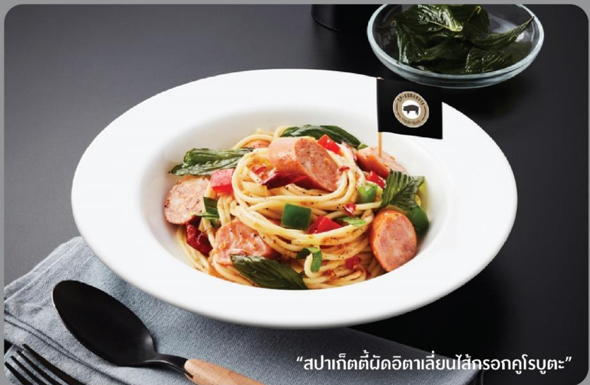
“สปาเก็ตตี้ผัดอิตาลีเส้นไส้กรอกคุโรบูตะ”