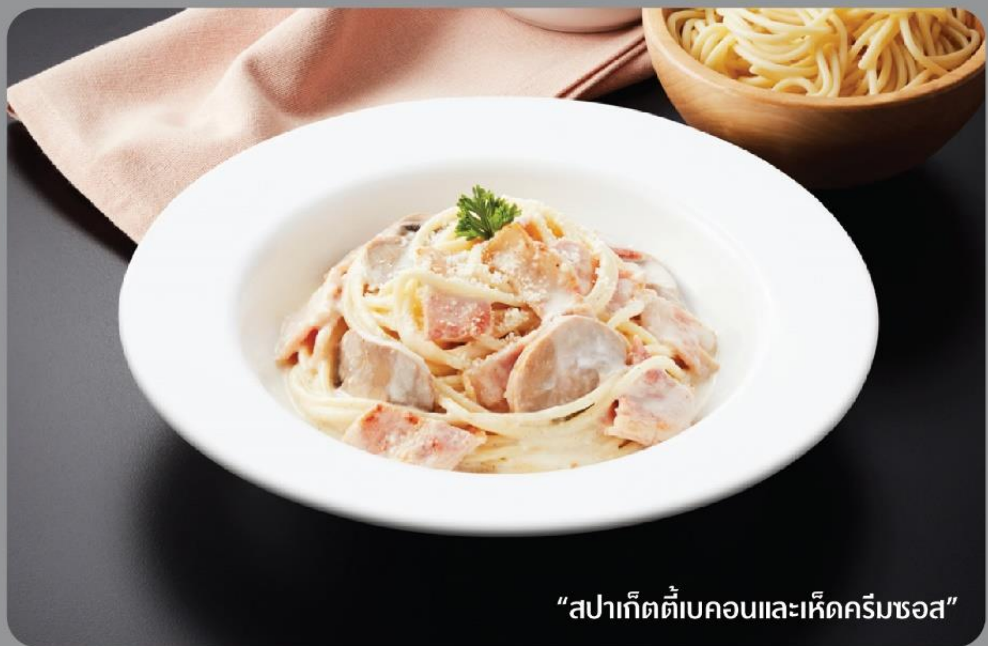
“สปาเก็ตตี้เบคอนและเห็ดครีมซอส”

“สปาเก็ตตี้ผัดอิตาลีเส้นไส้กรอกคุโรบูตะ”