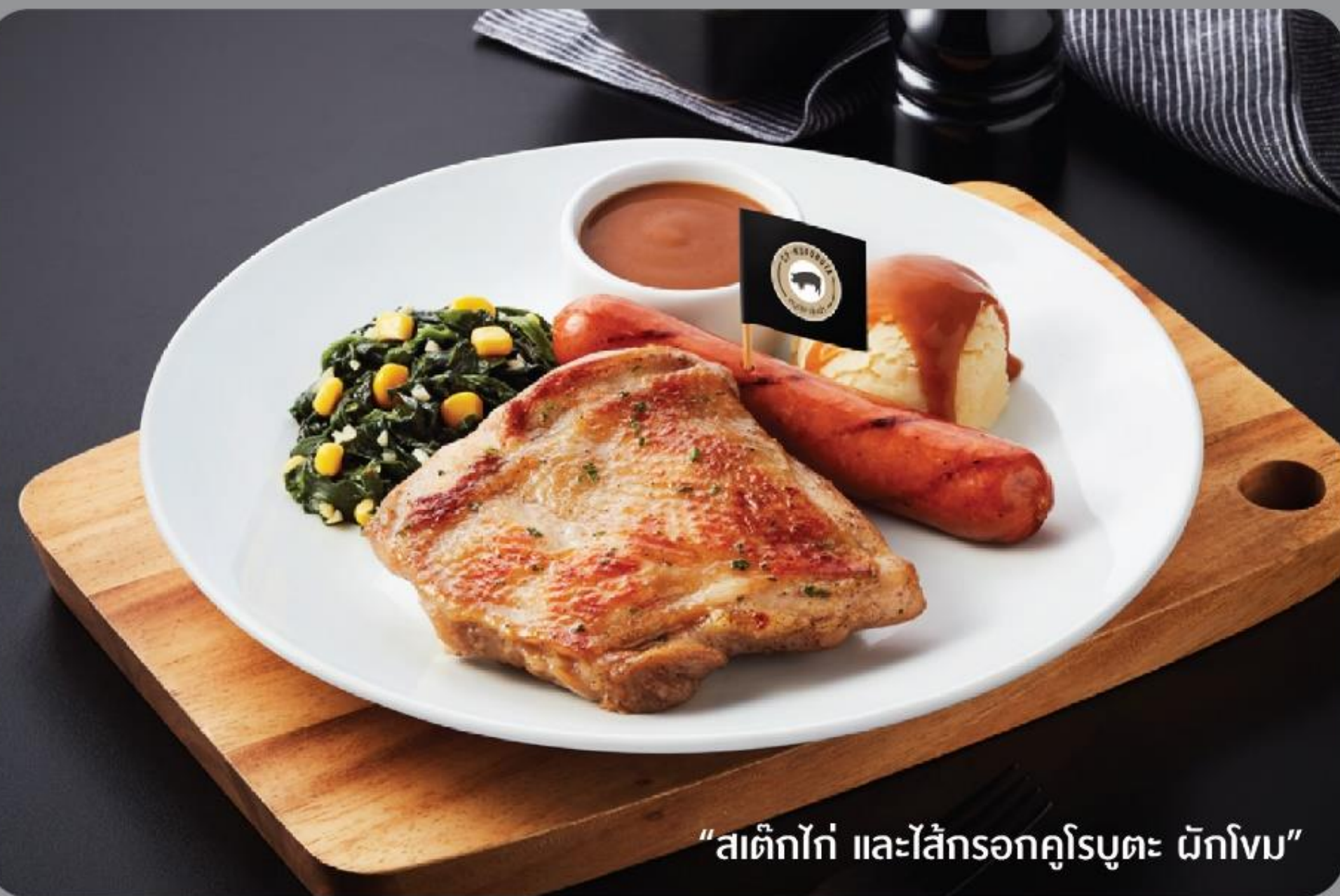
“สตั๊กไก่ และไส้กรอกคุโรบูตะ ด้กโงม”