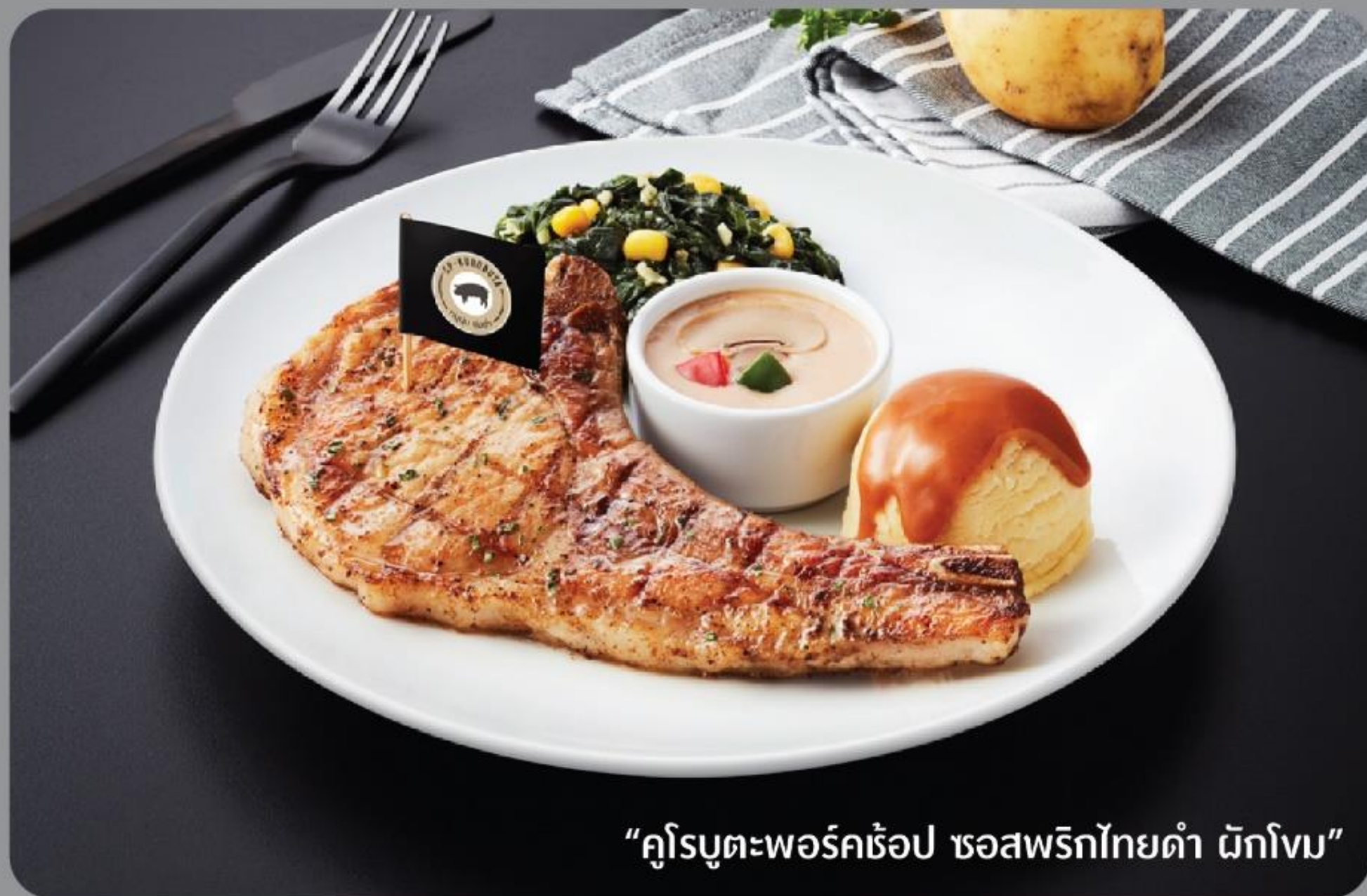
“คูโรบูตะพอร์คช้อป ซอสพริกไทยดำ ด้กโงม”

“สเต็กสันคอหมู และไส้กรอกคูโรบูตะ ด้กโงม”