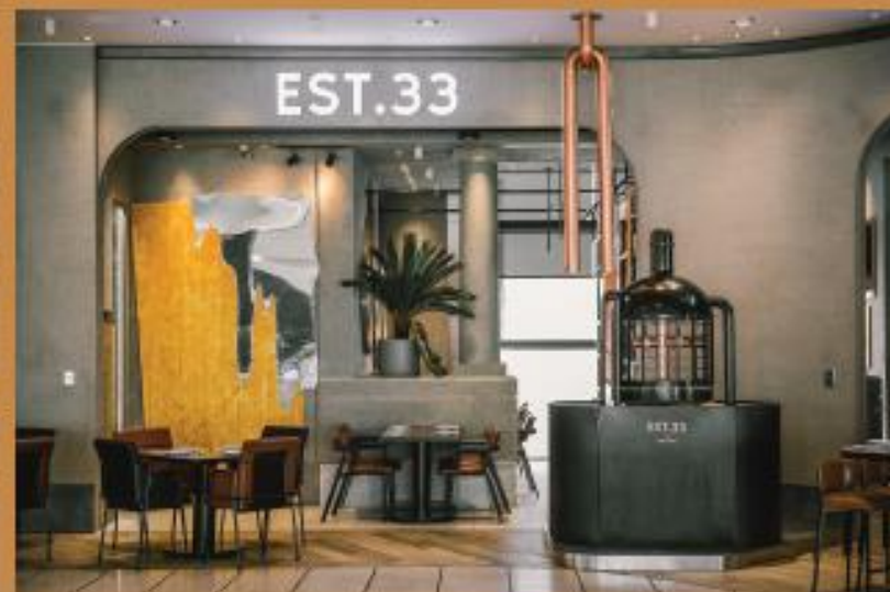
EST.33 Singha Complex