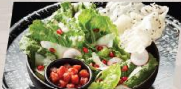
Caesar Crispy Salad ซีซาร์สลัด