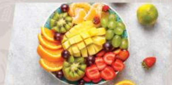
Seasonal Fruit ผลไม้ตามฤดูกาล