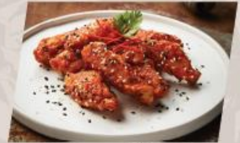
Sesame Wings ปีกไก่ทอดซอสวา