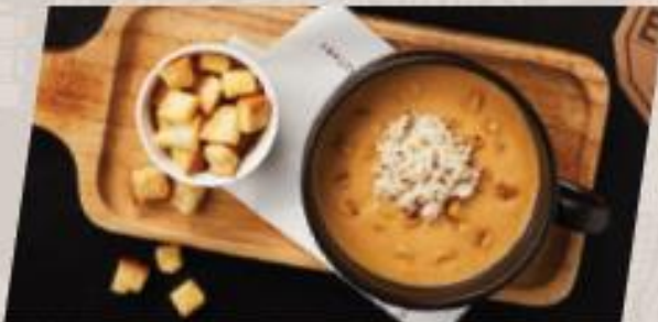
Crab and Corn ซูปครีมปูข้าวโพดย่าง

*ราคา set มีพวคนับรวมเครื่องดื่ม **ราคาไม่รวม vat และ service charge