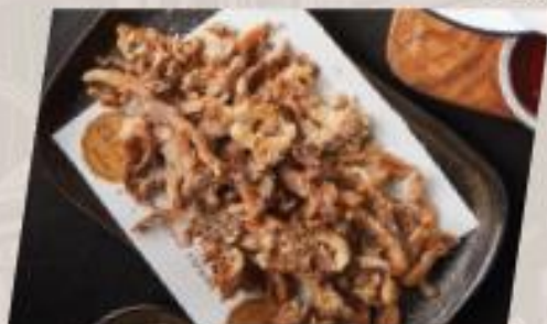
Heavenly Mushroom เห็ดสวรรค์โรยข้าวมอลต์คั่ว