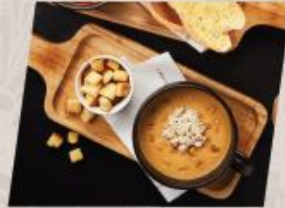
Crab and Corn ซุปครีมปูข้าวโพดย่าง