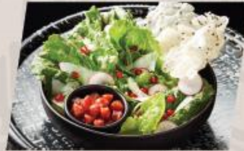
Caesar Crispy Salad ซีซาร์สลัด