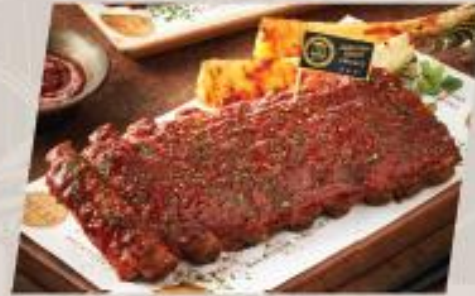
ESTer Ribs Classic / Spicy ซี่โครงหมูอบซอสบาร์บีคิวรสคลาสสิก / สานเฟ็ด สูตร EST.33