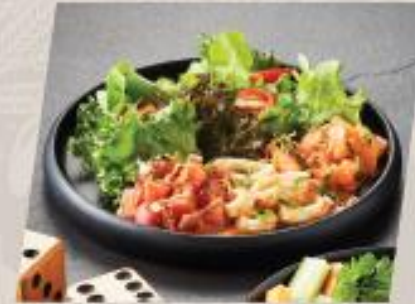
Trio Seafood Wazabi ยำซีฟู้ดกับซอสวาซาบิ