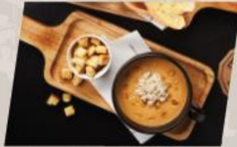
Crab and Corn ซูปครีมปูข้าวโพดย่าง