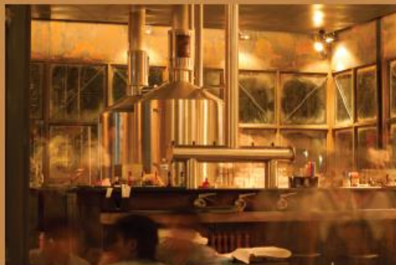
EST.33 The Nine Center Rama 9