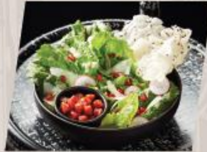
Caesar Crispy Salad ซีซาร์สลัด