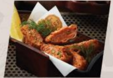
Fish in the bottle ทอดมันกุ้งและปลา