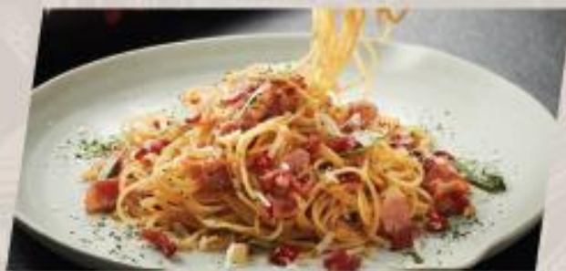
Oh!!! Bacon พาสต้าผัดพริกแห้งกระเทียมเบคอน