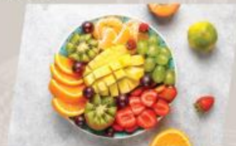
Seasonal Fruit ผลไม้ตามฤดูกาล