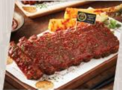
ESTer Ribs Classic / Spicy ซี่โครงหมอบซอสบาร์บิควอร์ลคาลาซิก / รสเผ็ด ชุด EST.33