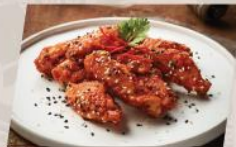
Sesame Wings ปีกไก่ทอดซอสวา