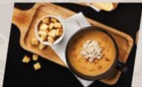
Crab and Corn ซุปรวมปูข้าวโพดย่าง

*ราคา set ข้างต้นไม่รวมเครื่องดื่ม **ราคาไม่รวม vat และ service charge