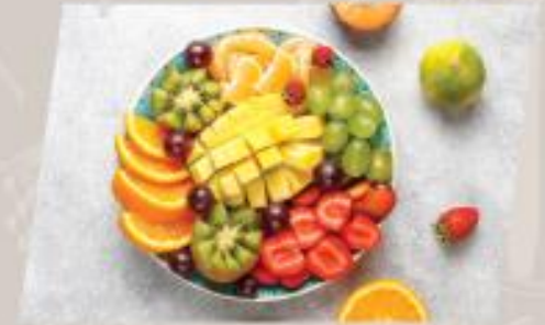
Seasonal Fruit ผลไม้ตามฤดูกาล