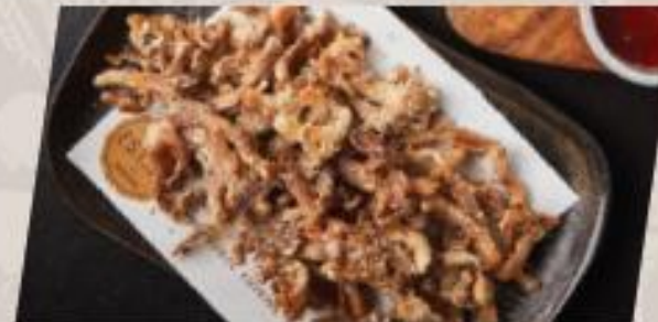
Heavenly Mushroom เห็ดสวรรค์โรยข้าวมอลต์คั่ว