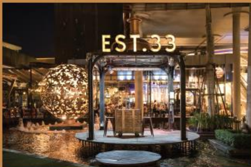
EST.33 Crystal Design Center