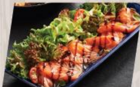
Salmon Gravlax Salad สลัดแซลมอนสไลด์สแกนดิเนเวีย