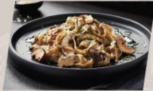
Truffle Alfredo พาสต้าอัลเฟรโดครีมทรัฟเฟิล