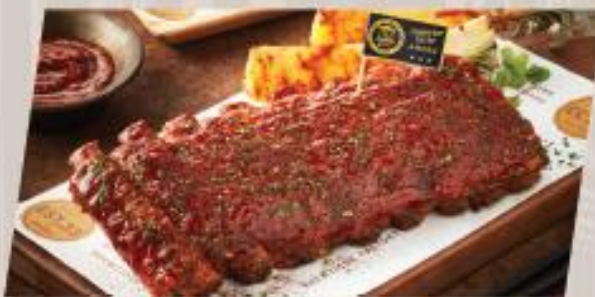
ESTer Ribs Classic / Spicy ซี่โครงหมูอบซอสบาร์บีคิวรสคลาสสิก / สลัด ผัก สูตร EST.33