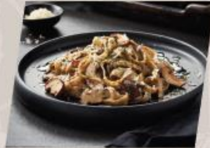
Truffle Alfredo พาสต้าอัลเฟรโดครีมทรัฟเฟิล