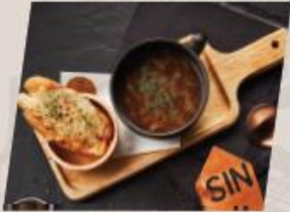
Onion Soup ซุปหัวหอมน้ำใส

*ราคา set ข้างต้นไม่รวมเครื่องดื่ม **ราคาไม่รวม vat และ service charge