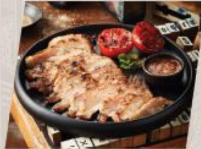
Kurobuta Pork Neck คอหมูดำย่างตามสันกุเฮาไฟ