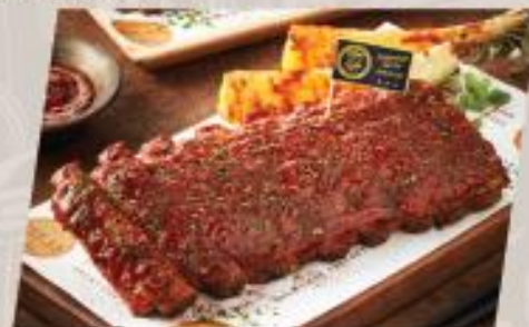
ESTer Ribs Classic / Spicy ซี่โครงหมูอบซอสบาร์บีคิวรสคลาสสิก / รสเผ็ด สูตร EST.33