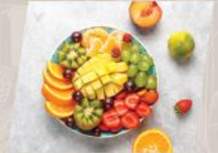
Seasonal Fruit ผลไม้ตามฤดูกาล