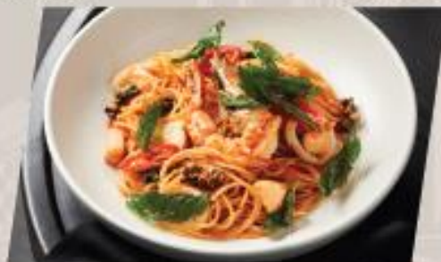
Kee Mao Seafood พาสต้าผัดซีเมาทะเลสดผัด