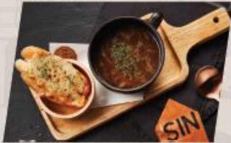
Onion Soup ซูปหัวหอมน้ำใส

*ราคา set ยังต้นไม้วางเครื่องดื่ม **ราคาไม้วาง vat และ service charge