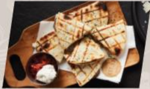
DE-YA เคสชาติย่างไก่หมักเบียร์